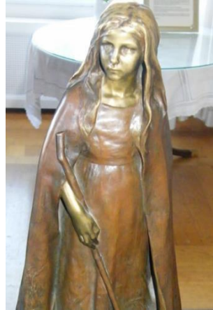
Bild 36: "Den Lille vallpige" av den danske skulptören Bertel Thorvaldsen 1770–1844